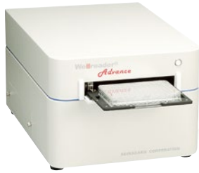
ウェルリーダーアドバンス